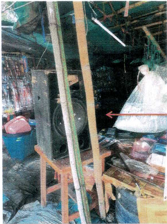
ลำโพงที่ตั้งไว้บริเวณด้านหน้าร้าน (ติดกับฟุตบอล)