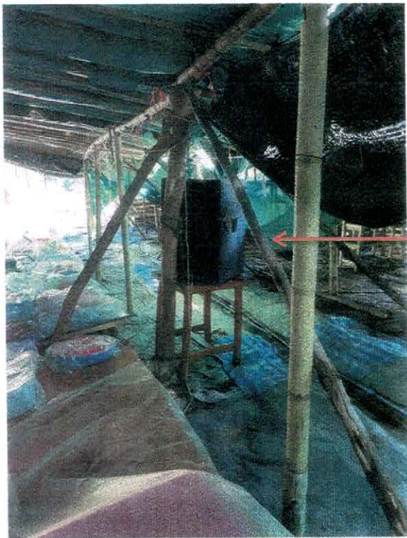
ลำโพงที่ตั้งไว้บริเวณด้านหลัง