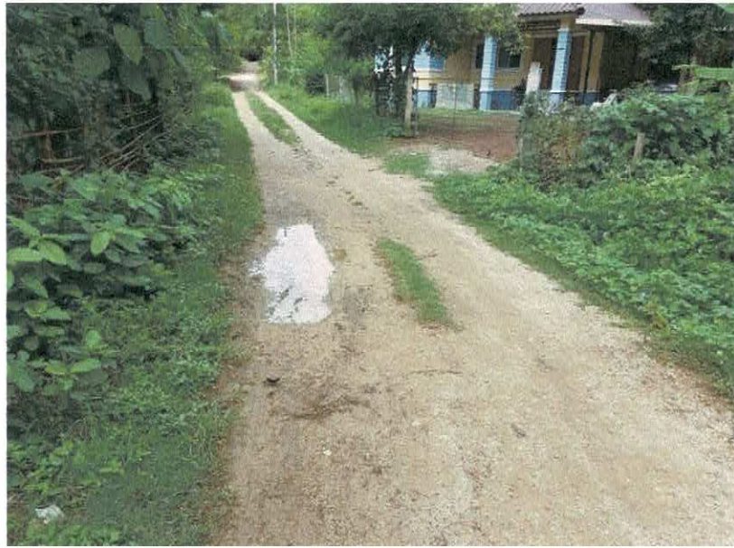
ภาพถ่ายสภาพถนนสายเลียบบเหมือนแม่โปงตอนบน บ้านปงชัย หมู่ที่ ๕ ตำบลแม่เมาะ อำเภอแม่เมาะ จังหวัดลำปาง